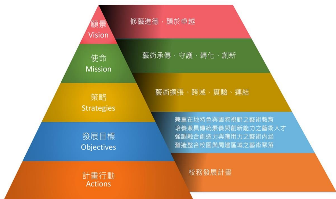
本校願景、使命與策略架構圖