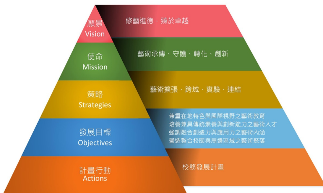
本校願景、使命與策略架構圖